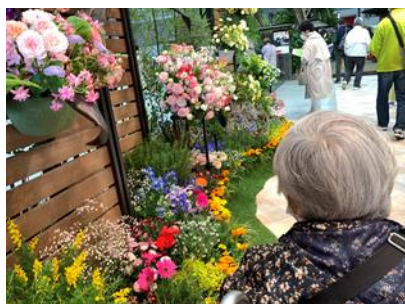
・その他日常の様子、2階の子供達との交流