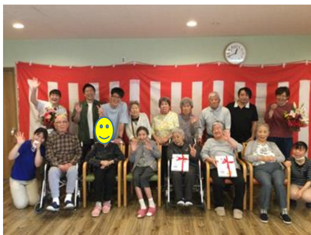
・日常風景（絞り染め、お絵描き教室、体操、ぼた餅作り、ベルコさん来所によるフラワーアレンジメントなど）